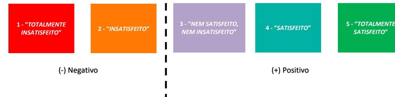
Figura 1 –Escala percecional de Likert

A estrutura do questionário compreendia 14 questões, agrupadas em quatro dimensões de desempenho organizacional: “ Serviços Prestados ”, “ Acessibilidade ” e “ Imagem da global da organização ”, “”, avaliadas através de uma escala percecional de Likert de 5 níveis, sendo que são consideradas negativas as avaliações inferiores a 3.