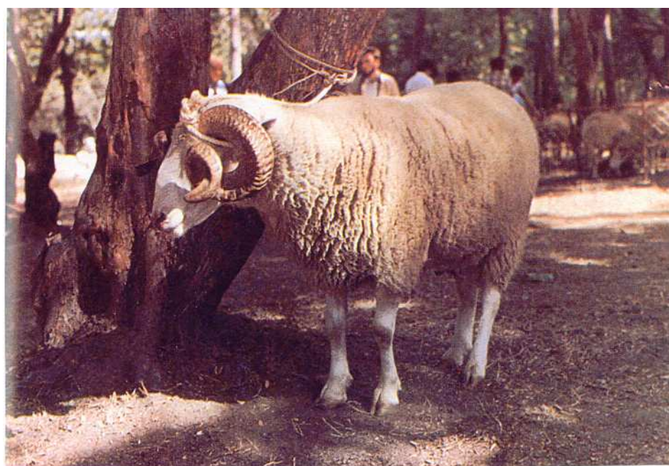
Fig. 1 – Exemplar da raça Bordaleira Serra da Estrela, variedade branca.

As únicas raças exploradas, para a produção de Queijo Serra da Estrela tal como estão documentadas nas fotografias 1, 2 e 3, são a Bordaleira Serra da Estrela nas variedades “Branca” e “Preta” ( a mais representativa na região) e a Churra Mondegueira com menor dispersão e representatividade no efectivo ovino da região. ( ver anexo I - descrição das raças).