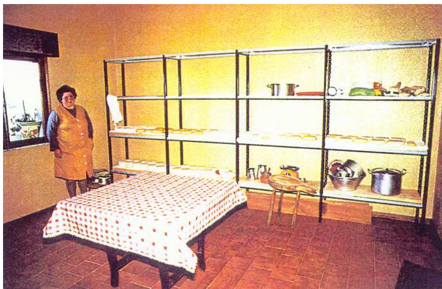
Fig. 10 – Aspecto geral de uma sala de cura, em que a alvenaria tem o seu máximo de expressão.

Nas queijarias semi-artesaniais ou de maior dimensão, o saber fazer encontra-se aliado à inovação, com a introdução de instalações de cura com ambiente controlado.