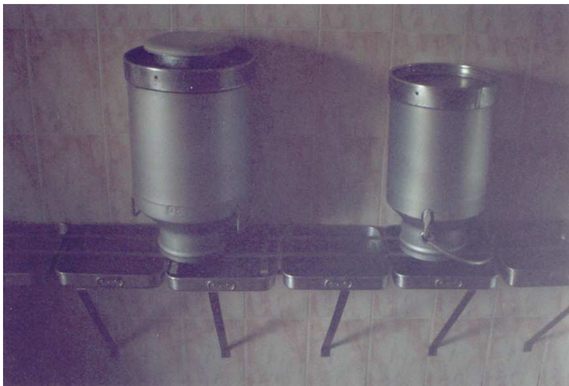
Fig. 5 – O transporte do leite é efectuada em bilhas de aço inoxidável. Uma vez chegado à queijaria, o leite é laborado e as bilhas são devidamente higienizadas e colocadas a secar.

Estes recipientes devem ser transportados sobre “chassis” rodoviários.