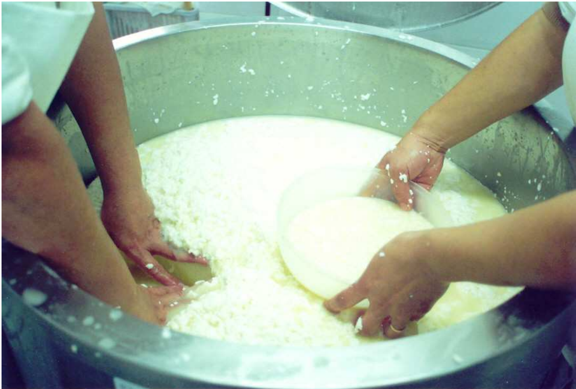
Fig. 6 – Após o corte da coalhada, com a ajuda de um recipiente distribui-se a mesma pelos cinchos.

Decorridos quarenta e cinco a sessenta minutos a coalhada está em condições de ser trabalhada. É efectuado o corte manual, grosseiro, com a ajuda da colher ou da lira, seguido ou não de pequeno repouso e da sua gradual distribuição em panos brancos que, depois de apertados para saída de soro, são colocados em cinchos (com diâmetro ajustável à massa, de forma a obter-se um diâmetro de 13 a 20 cm e uma altura de 8 a 10 cm) (ver fig. 6).