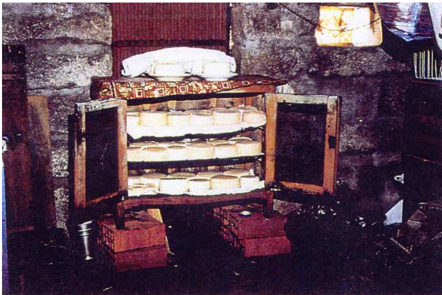
Fig. 9 – Aspecto geral de uma antiga sala de cura, numa queijaria artesanal onde o granito influenciava as condições ambientais da habitação.

Na sala de cura propriamente dita, os queijos encontram-se dispostos em prateleiras, onde as viragens e lavagens se fazem diariamente, fazendo-se com menos frequência à medida que a cura avança.