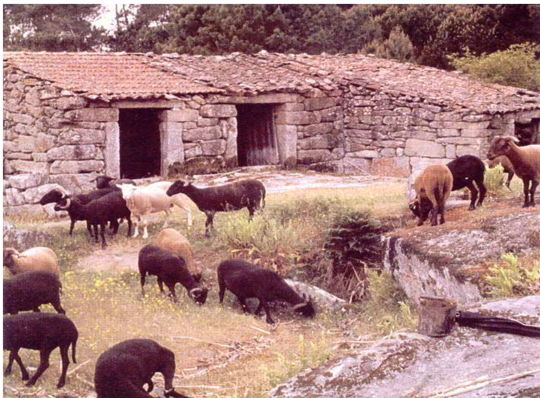
Fig. 2 – Ovelhas leiteiras da raça Bordaleira Serra da Estrela, nas variedades branca e preta.