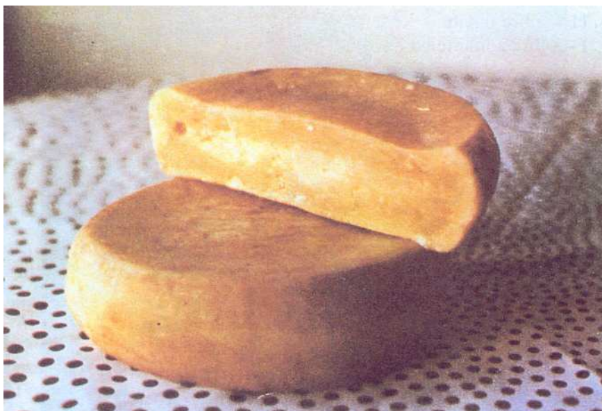
Fig. 12 – Queijo Serra da Estrela Velho, cujo tempo mínimo de cura é de 120 dias.