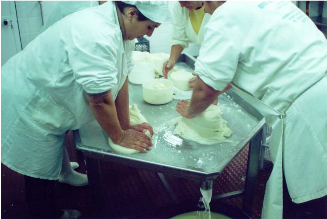
Fig. 7 – Distribuição da coalhada por cinchos e respectiva compressão manual , até ao esgotamento total do soro, que escorre pela francela.

As mãos são as principais obreiras. Há que ter “boa mão” para fazer queijo. Mãos frias, ao contrário do que se pode pensar, são as melhores.