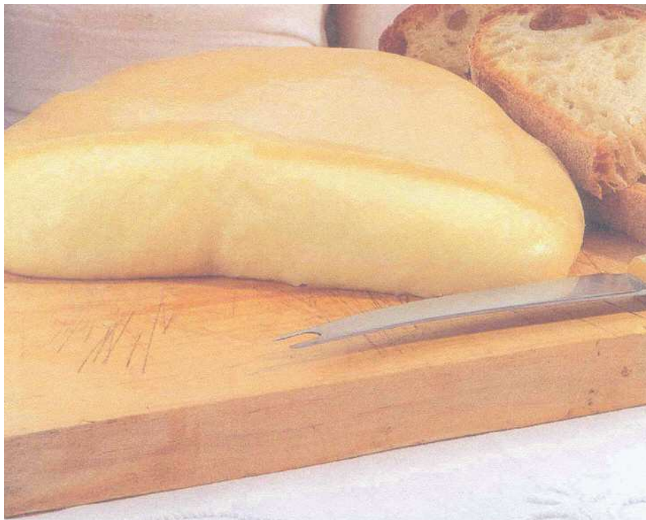
Fig. 11 – Queijo Serra da Estrela, cujo tempo mínimo de cura é de 30 dias.

No fim do processo descrito, os queijos apresentam-se com o seguinte aspecto: