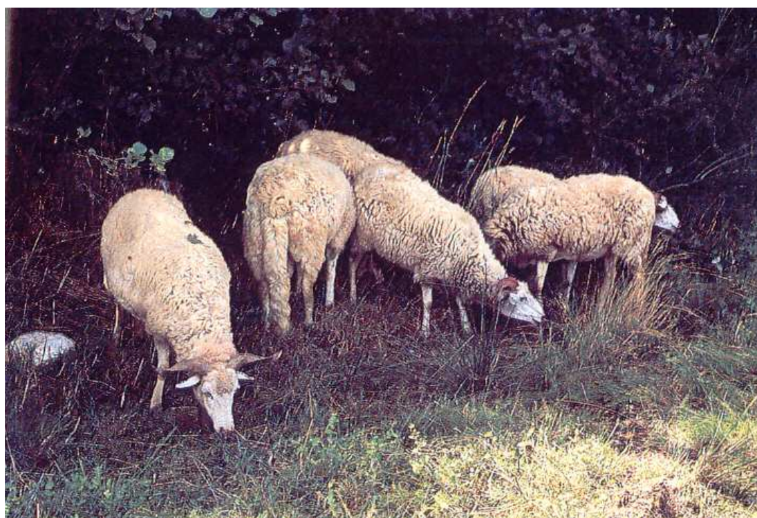
Fig. 3 – Exemplos da raça Churra Mondegueira