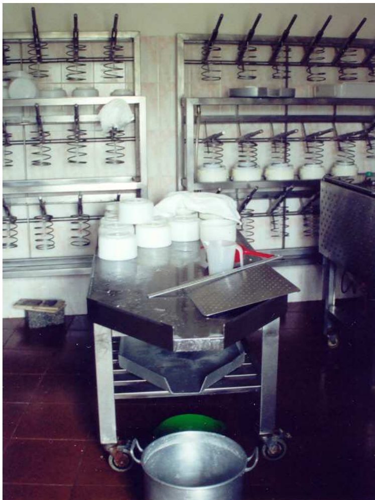
Fig. 8 – Aspecto geral de uma queijaria, onde se salienta a prensa.