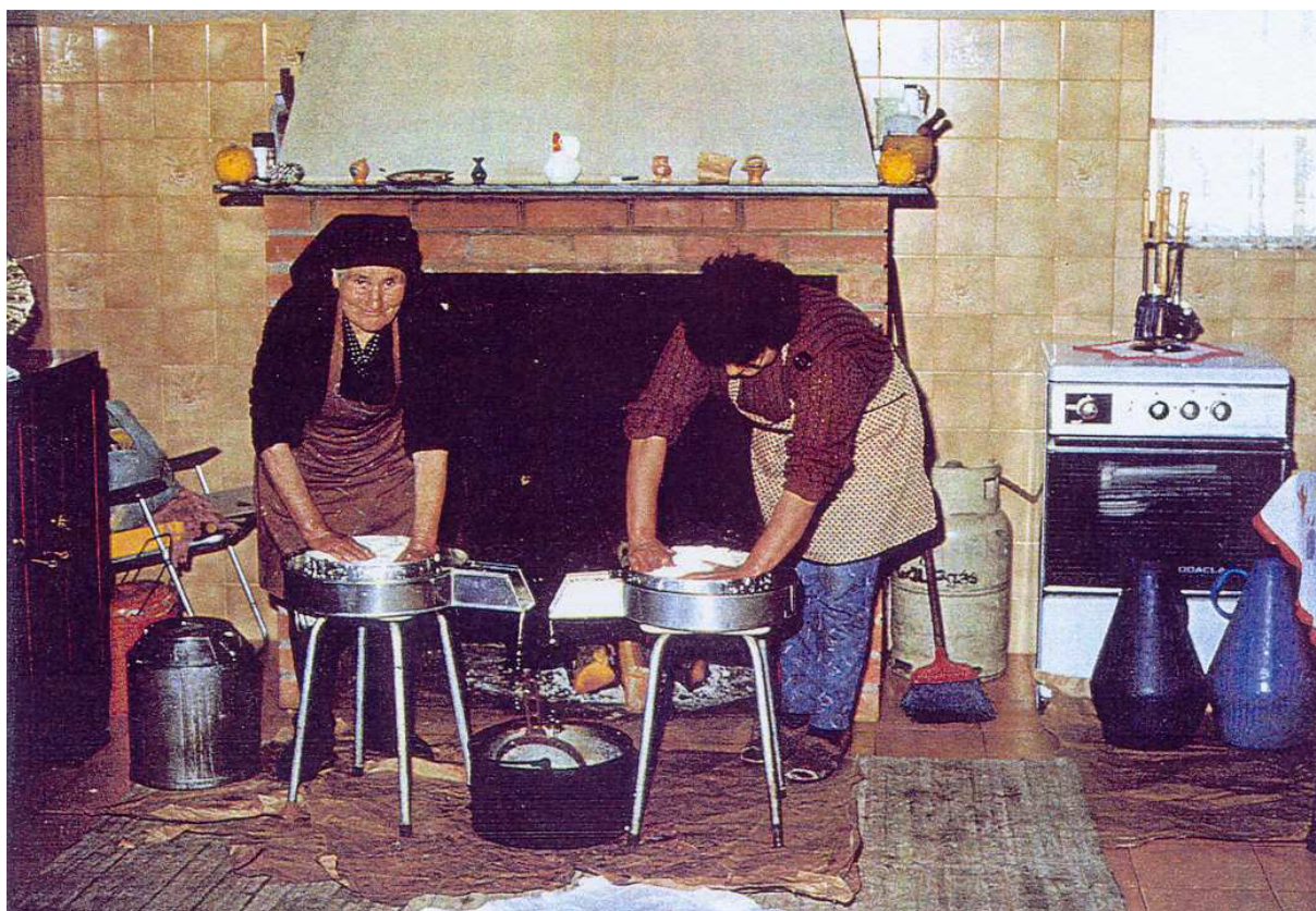
Fig. 4 – Produção Artesanal de Queijo Serra da Estrela em meados do século passado

Os melhores queijos produzem-se nas explorações familiares – “queijos de quinta”, onde as tarefas se repartem. Por norma o marido é o pastor e a esposa a queijeira. Sendo as produções limitadas (2 a 4 queijos/ dia), estão reunidas as condições para que em cada queijo se reflecta uma ligação “artesão/produtor”, o que faz com que se considere que “fazer queijo, não é só Saber, mas também é Arte!”.